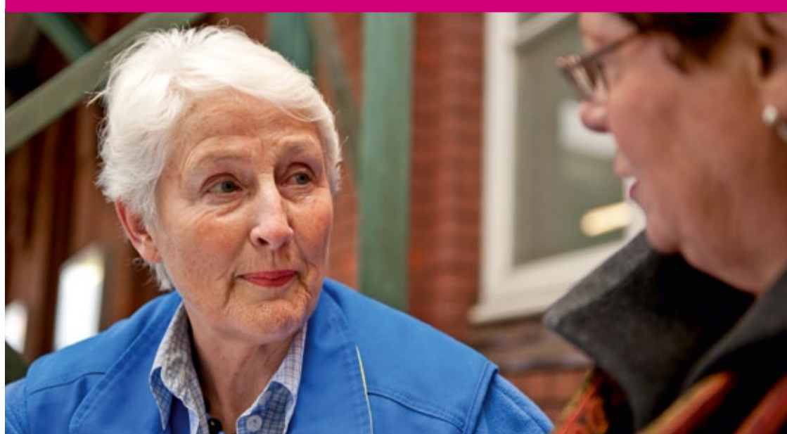
Heute hilft ein Kuscheltier, morgen ein offenes Ohr: Ehrenamt ist so bunt wie das Leben

Frauen brauchen verlässliche Schutzräume