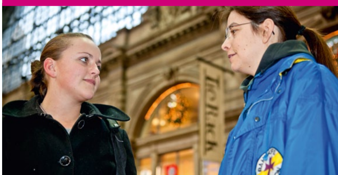
Immer mehr Frauen sind auf der Flucht vor Gewalt, Armut und Perspektivlosigkeit